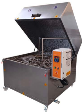
LAVADORAS DE CESTA GIRATORIA CON AMORTIGUADOR