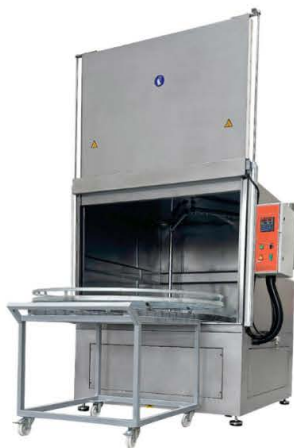
LAVADORA NEUMÁTICA DE CESTA GIRATORIA DE CARGA FRONTAL