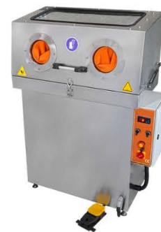
LAVADORA MANUAL CON CEPILLO Y CABINA CERRADA CON GANTES