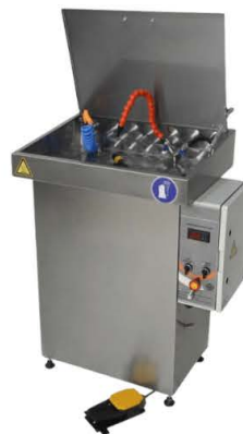
LAVADORA MANUAL DE CEPILLO